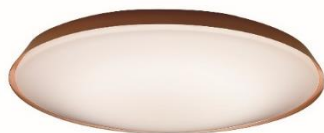
【製品例①】 AH55820 (Fit 調色タイプ～12 畳用)