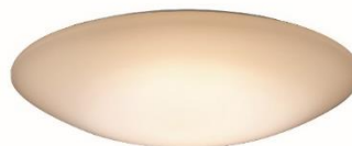
【製品例②】 AH55728 (調光タイプ ～12 畳用)